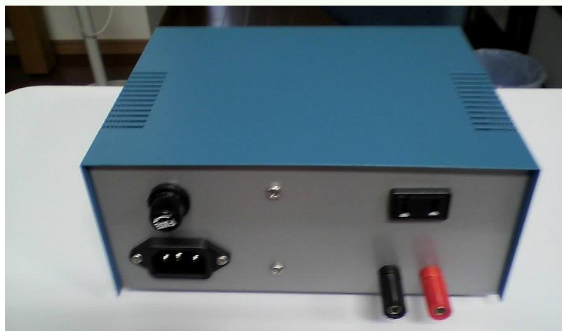
ヒーター及び熱電対接続部（右側）