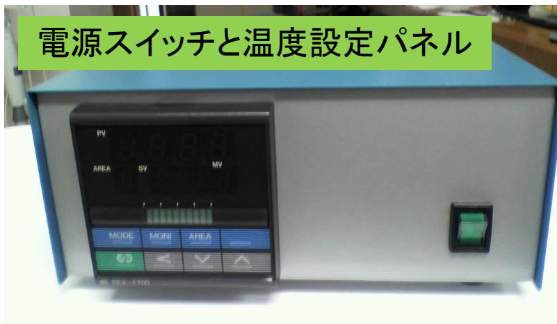
電源スイッチと温度設定パネル