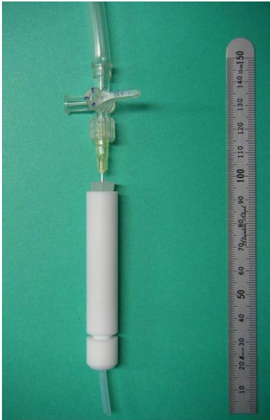
標準水素電極(上はガス導入部、下はルギン毛管)